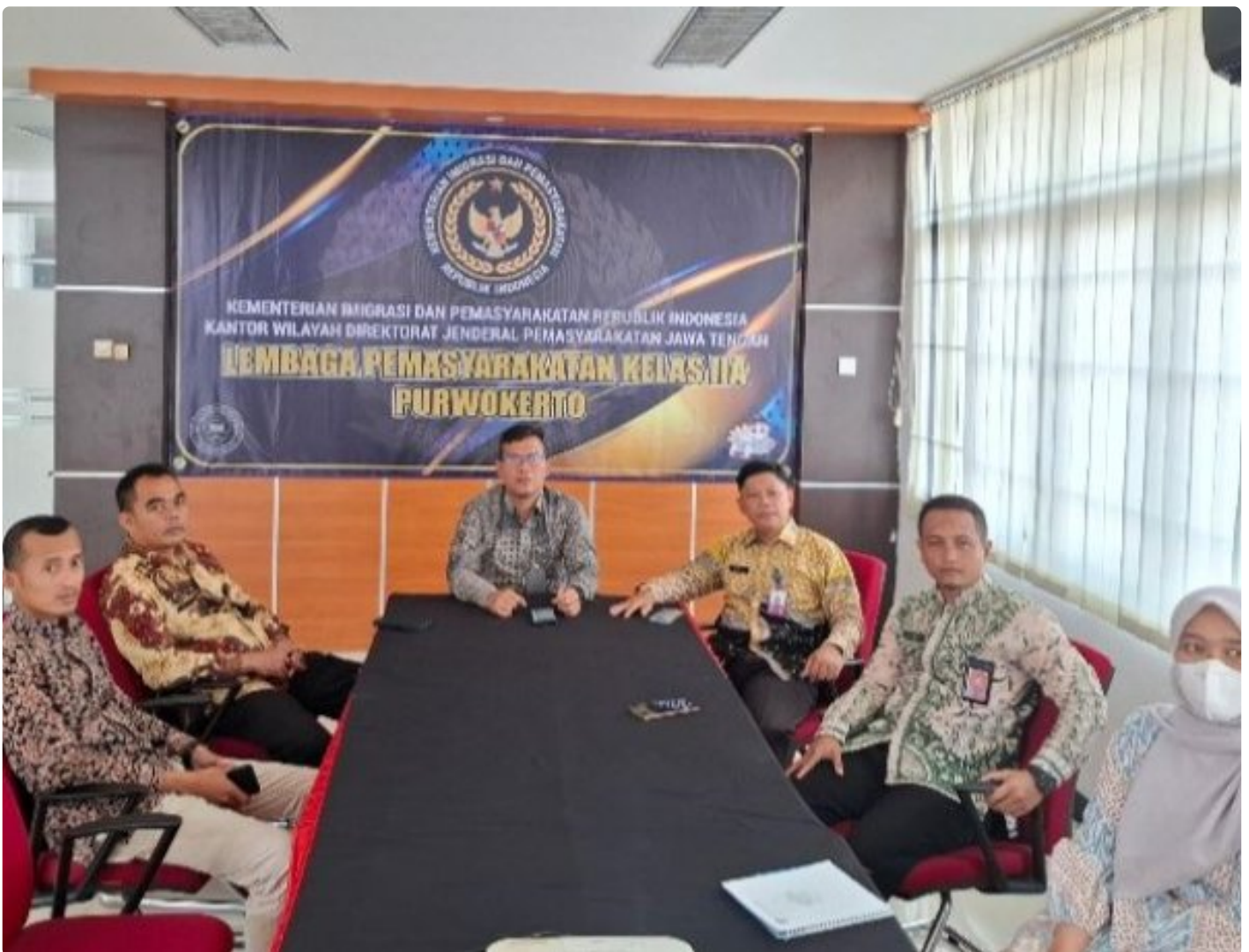
Lapas Kelas IIA Purwokerto Ikuti Entry Meeting Pemeriksaan BPK RI Atas Laporan Keuangan Kementerian Hukum dan HAM Tahun 2024 secara Virtual